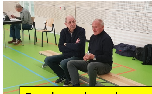
Tevreden coaches analyseren samen de wedstrijd

Geen winnaar, maar tevreden coaches, een mooie partij voetbal, tevreden publiek en een lekkere borrel na afloop bij Fortissimo.